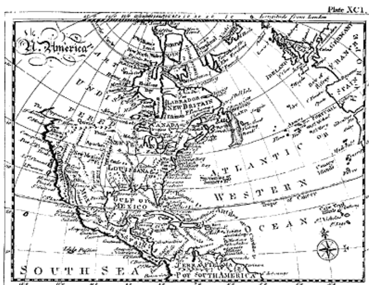
Рис. 4. Карта Северной Америки из Британской Энциклопедии XVIII века [43], т. 2, с. 682–683. Plate XCI. Обратите внимание, что северо-западная часть континента на карте НЕ ИЗОБРАЖЕНА. Европейским картографам она была неизвестна