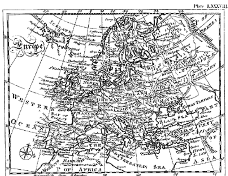
Рис. 1. Карта Европы из Британской Энциклопедии XVIII века [43], т. 2, с. 682–683. Plate LXXXVIII

В разделе «География» Британской Энциклопедии 1771 года приведены, в частности, пять общих географических карт Европы, Азии, Африки, Северной и Южной Америки. Мы воспроизводим их на рис. 1–5. Карты составлены очень тщательно, с подробными очертаниями материков и островов. Нанесено множество названий городов, рек, озер. Составители карт Британской Энциклопедии 1771 года были, например, прекрасно осведомлены о географии далекой и труднодоступной для европейцев Южной Америки, рис. 5. Подробно, со знанием дела, изображена река Амазонка, протекающая в диких тропических лесах, где в XVIII веке не везде даже ступала нога европейца.