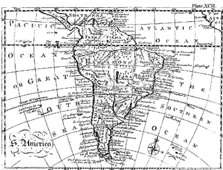
Рис. 5. Карта Южной Америки из Британской Энциклопедии XVIII века [43], т. 2, с. 682–683. Plate XCII

Но вот что странно. При таких глубоких и всесторонних познаниях в географии южно-американского континента и других отдаленных земель, у английских картографов XVIII века почему-то полностью отсутствовали представления о СЕВЕРО-ЗАПАДНОЙ ЧАСТИ СЕВЕРНОЙ АМЕРИКИ! Имеется в виду та ее часть, которая примыкает к Сибири через Берингов пролив, и где расположена русская Аляска, рис. 4. Не странно ли, что англичане, которые, как считается, в основном и освоили северо-американский континент, до конца XVIII века так ничего и не знали об этой обширнейшей его части? В то время как остальные места Северной и Южной Америки были им известны достаточно хорошо.