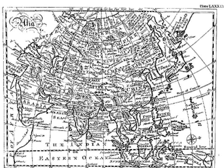
Рис. 2. Карта Азии из Британской Энциклопедии XVIII века [43], т. 2, с. 682–683. Plate LXXXIX